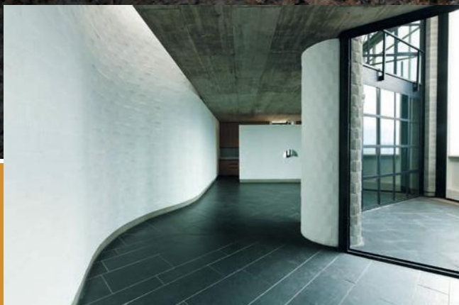
Posa sicura di pietra naturale in aree interne ed esterne

Con i prodotti ARDEX per pietra naturale fate sempre la scelta giusta perché l'effetto ARDURAPID® garantisce un legame completo e rapido con l'acqua d'impasto, evitando la penetrazione di umidità nel rivestimento in pietra naturale, pigmentazioni, efflorescenze e deformazioni.